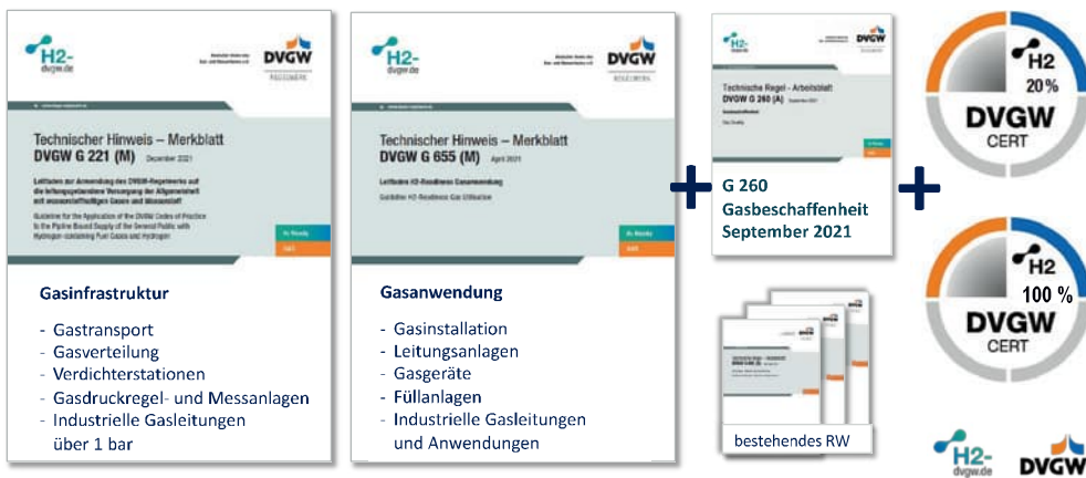
Abb. 2: DVGW-Wasserstoffleitfäden für Infrastruktur und Gasanwendung sowie Zertifizierungsprogramme

die Projekte „H 2 -20“ und „Roadmap Gas 2050“ bestätigt, dass für die Leitungen der Gasinstallation keine zusätzlichen Maßnahmen erforderlich sind und für die Gasgeräte im Bestand die grundsätzliche Eignung gegeben ist. Voraussetzung ist – wie bei Erdgas –, dass die Leitungen und Gasgeräte entsprechend den Vorschriften und Regelwerken ordnungsgemäß eingestellt sind und bestimmungsgemäß betrieben und instandgehalten werden. Dies ist, wie bei Erdgas auch, durch den Kunden über eine entsprechende Beauftragung einer Fachfirma sicherzustellen (Wartungsvertrag). Im Abschlussbericht zu dem Forschungsprojekt wurde zudem auch die Absenkung der relativen Dichte im Vergleich zum DVGW-Arbeitsblatt G 260 empfohlen, um die Rechtssicherheit für z. B. Netzbetreiber zu erhöhen. Die Netzbetreiber sind für die Bereitstellung der Gasbeschaffenheit in der Form verantwortlich, dass die installierten üblichen Gasgeräte weiterhin ordnungsgemäß betrieben werden können. Zu den Details hat der DVGW, ergänzend zur DVGW-TRGI (G 600) und dem DVGW-Merkblatt G 655, das Rundschreiben G 06/2023 veröffentlicht, in welchem die Erkenntnisse aus den Forschungsergebnissen sowie eines Rechtsgutachtens zu der Thematik zusammengefasst wurden.