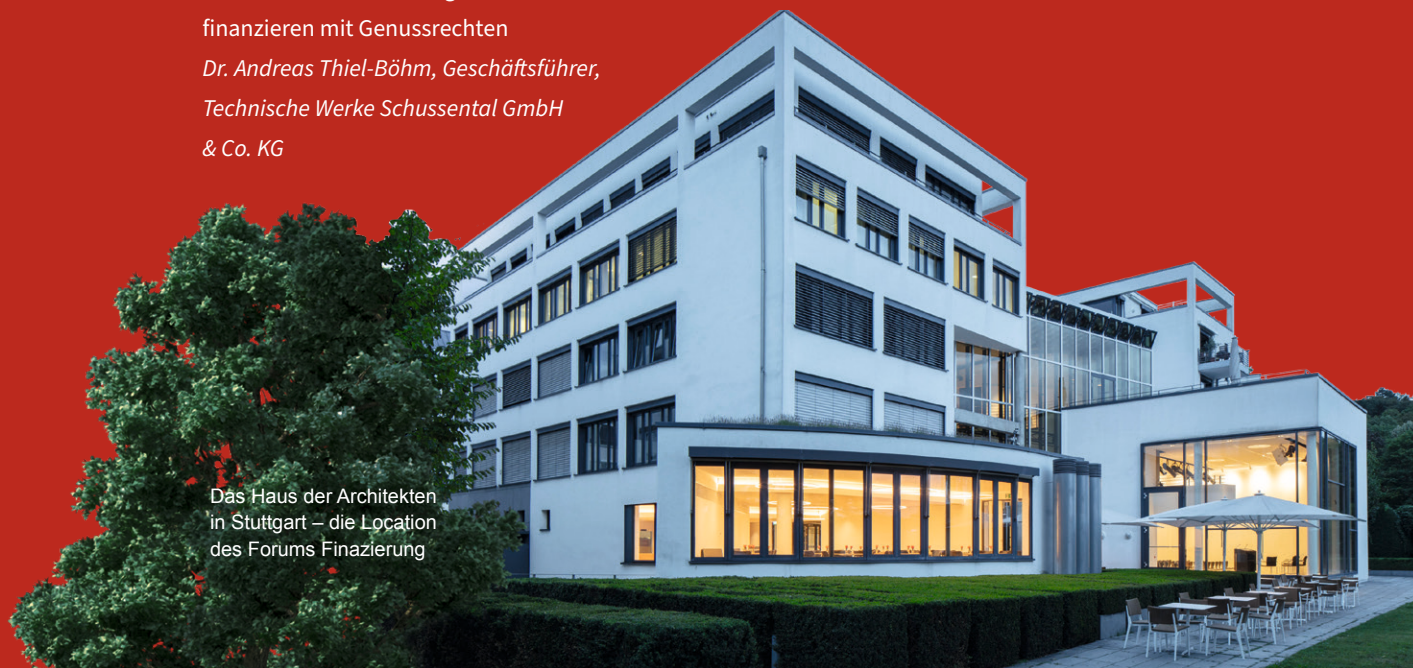
Das Haus der Architekten in Stuttgart – die Location des Forums Finanzierung